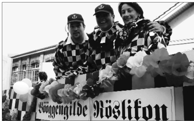
Die Bööggengilde lädt zur Fasnacht. (Archiv)

Acht Tage später, am Samstag, 11. März, ist dann richtig Fasnacht für die Röslikoner: Der grosse Maskenball steht